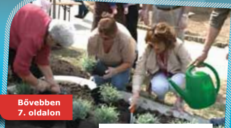
Együtt ültet a város