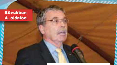
Győzött a Fidesz-KDNP