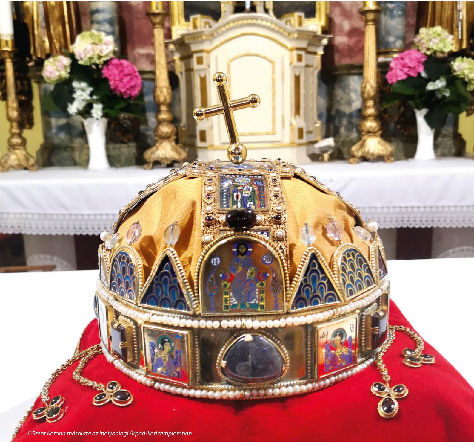
A Szent Korona másolata az ipolybalogi Árpád-kori templomban