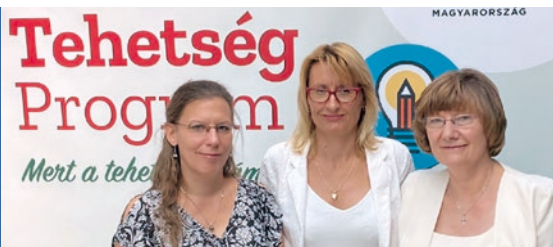
A Tehetségbarát Önkormányzat-díj átadóján

Augusztus 20.: Új díszpolgárai és díjazottjai vannak városunknak