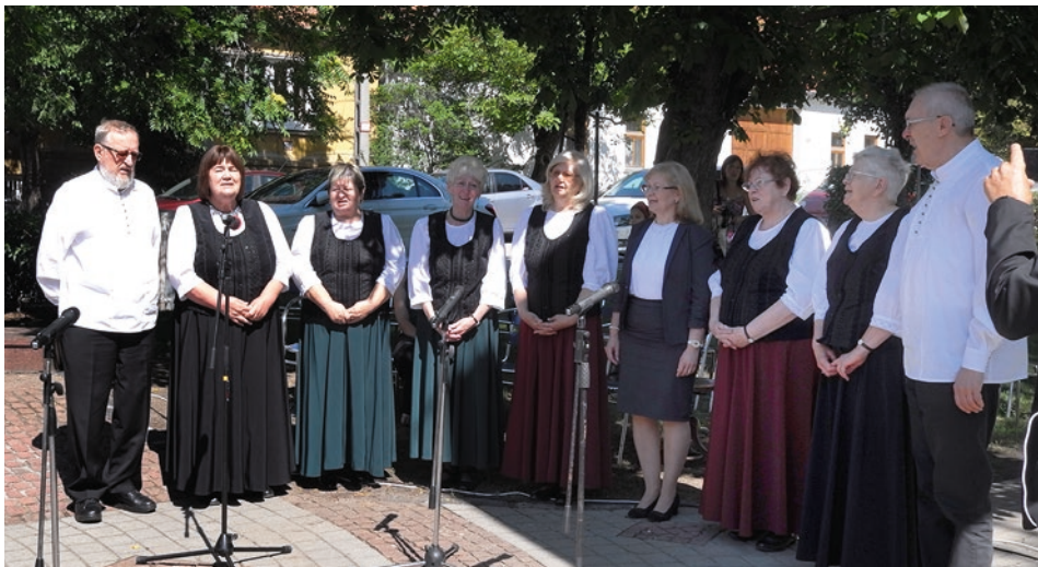
A Budakeszi Népdalkör fellépett az augusztus 20-i ünnepi műsorban is

A Népdalkör gyakran kap felkérést Budakeszi és egyéb települések vezetésétől helyi rendezvényeken való fellépésekre. A Magyar Népfőiskola Kollégium rendezvényein is rendszeresen adnak műsort, és külföldi városokba is több alkalommal eljutottak: Erdélybe, Kárpátaljára, Felvidékre. Minden előadáson odafigyelnek megjelenésükre, a műsor igényes megszólaltatására. Ezért szervezik évente Énekesműhely elnevezésű rendezvényüket Budakeszin, amelyre Budai Iлона Kossuth-díjas előadóművészt hívják meg egy napos továbbképzésre. Az eseményen megjelennek a környező és távolabbi települések népdalköreinek vezetői, tagjai. E rendezvénnyel bővítik, gondozzák a népdalkörök repertoárjait, és pontos eligazítást kapnak a tanult népdalok eredetéről is. A Budakeszi Népdalkör országszerte és határainkon túlra is Budakeszi jó hírét viszi. Tagjai töretlen lelkesedéssel munkálkodnak azon, hogy tovább vigyék a hagyományokat, meg-