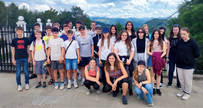
A 7. évfolyam Erdélyben járt a Határtalanul program keretében

pal, Challenge day-jel együtt került megrendezésre. Közös bemelegítés után az osztályok az olimpiai öt kariat alkották meg magukból a pályán, így tisztelegve a közelgő olimpia előtt. Ezt követően a kicsiknek sorverseny, nagyobbaknak focimeccsek, táncbemutatók és „kihívás” feladatok színesítették a napot. Óriási élmény volt, hogy minden osztály 10-20 percen át ugrálhatott két hatalmas ugrálóvárban. A napot az iskola ajándékként egy közös jégkrémezéssel zártuk! Jó érzés volt