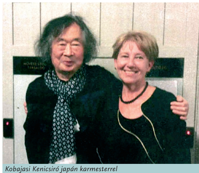
Kobajasi Kenicsiró japán karmesterrel

■ A három francia impresszionista, Ravel, Debussy, Satie, valamint Lajtha László (Bartók és Kodály zeneszerző társa) és a méltatlanul ritkán játszott Mosonyi Mihály (Erkel zeneszerző társa) műveinek cd-re rögzítése arra utal, hogy azért nem csak kortárs művek voltak a repertoárjában.