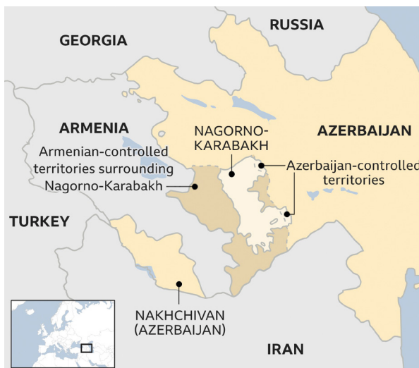
1. ábra. Arcah Köztársaság területe 1994-2020

Az első karabahi háborút az orosz közvetítéssel tető alá hozott 1994. májusi fegyverszünet zárta le, amelyet Azerbajdzsán és Örményország mellett Arcah is aláírt – Baku azonban hangsúlyozta, hogy ez nem jelenti