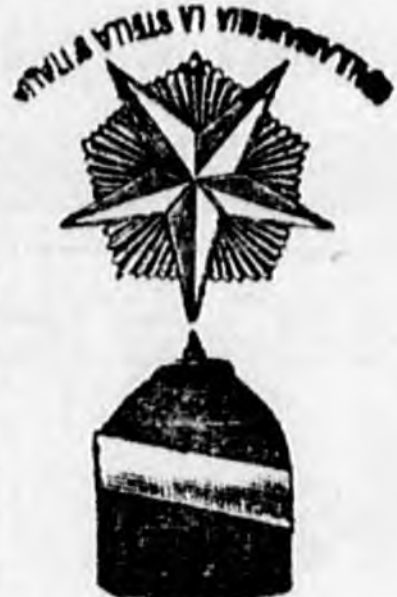
1898. évben tiszteletbeli taggá megválasztva