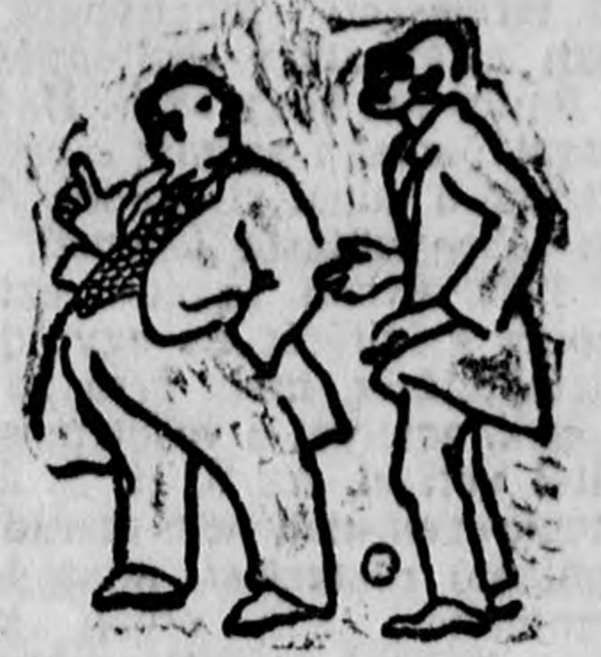
— Na, ezt a hosszú farsangot is kibőjtöltük szerencsésen!