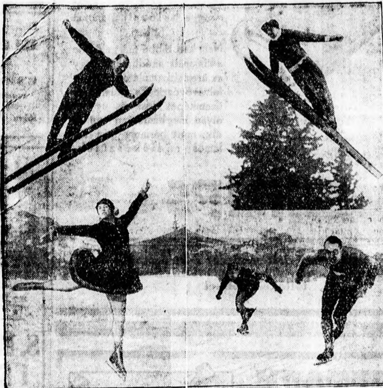
Pillanatfelvételek a davosi versenyről

mp.-es idejét. Thunberg új világrekordja 1 perc 28,4 mp. A norvég Ballangrud 5000 méteren állított fel új világrekordot, megjavítva mult évben Davosban fel-állított világrekordját. Régi rekordja 8 perc 24,6 mp. volt, míg az új világrekord három teljes másodperce-vel jobb.