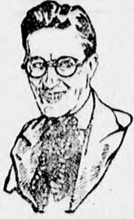
Harold Lloyd a főszerepben

A TENGHERI MEDVE vigjáték 5 felvonásban.