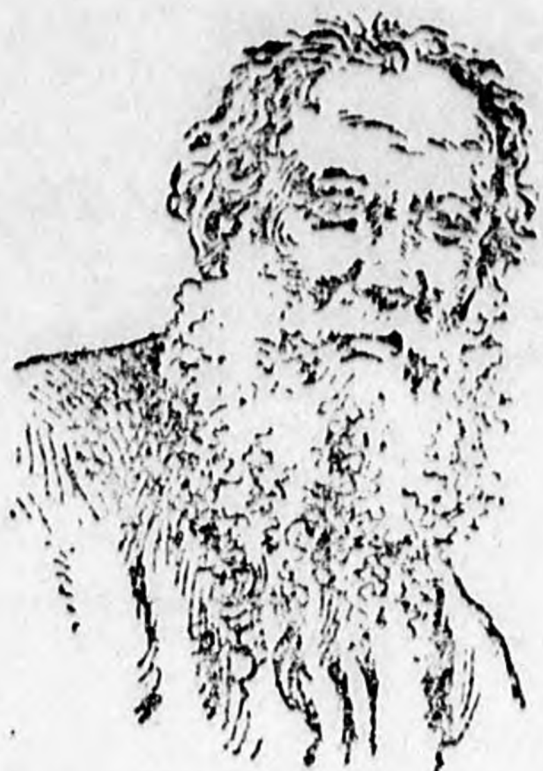
film n szől horzátok