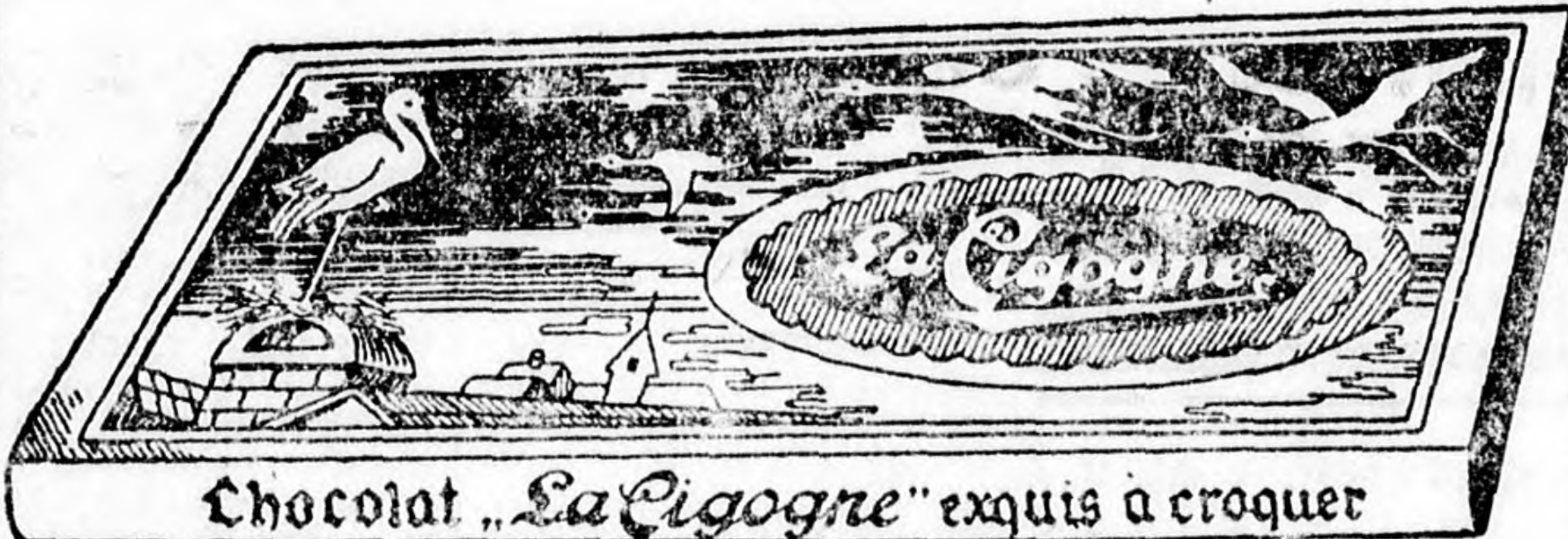
Chocolat „La Cigogne“ exquis à croquer