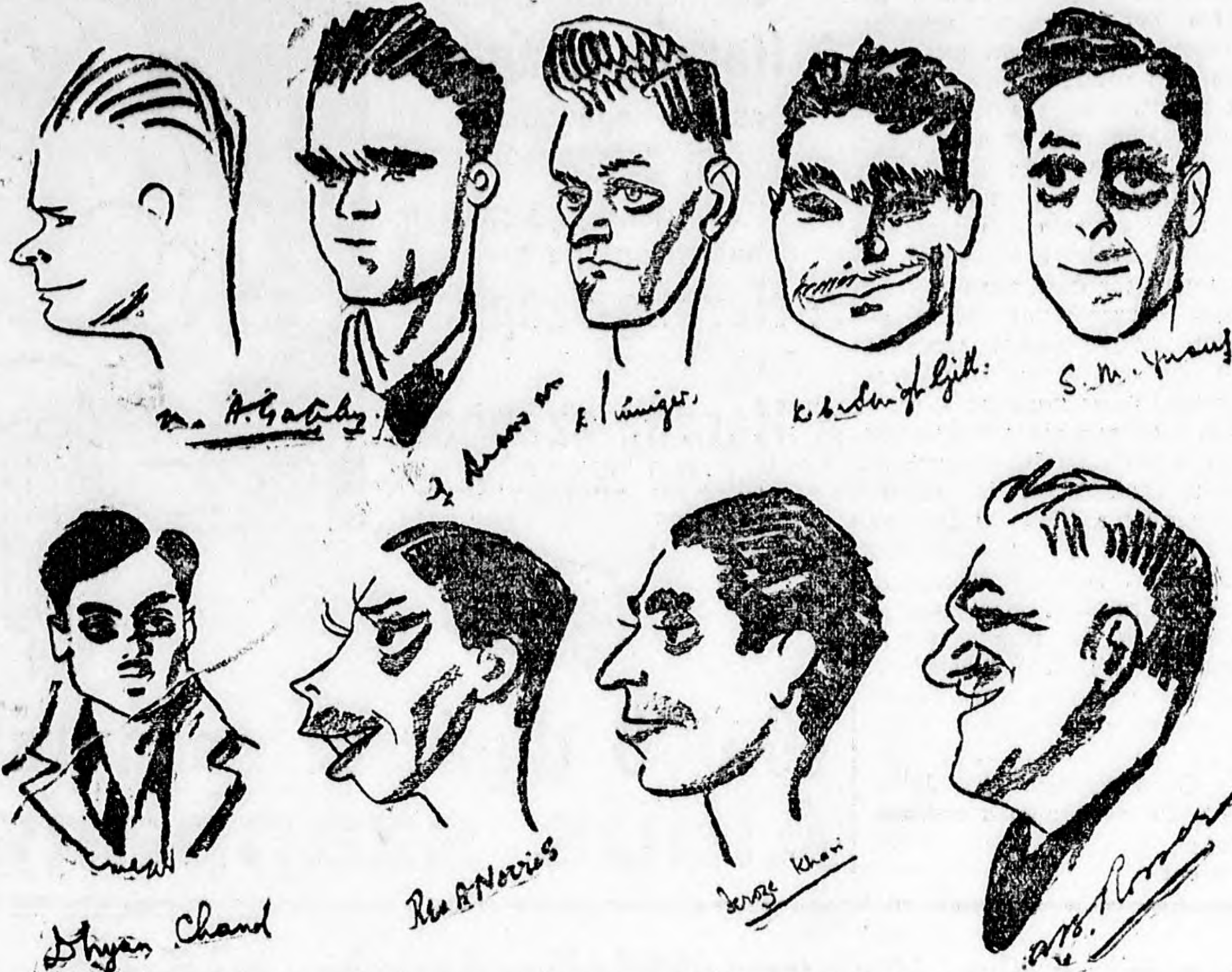
India hockey-csapata, az Olimpiád favoritja

Amszterdamból jelentik: Csütörtökön nyitották meg a kilencedik olimpiászt az amszterdami stadionban. A világversenyt Henrik herceg, a királynő férje nagy ünnepségek keretében nyitotta meg, majd utána megkezdődött az olimpiász első szakasza, a hocky-verseny, amelynek az indiai csapat a favoritja.