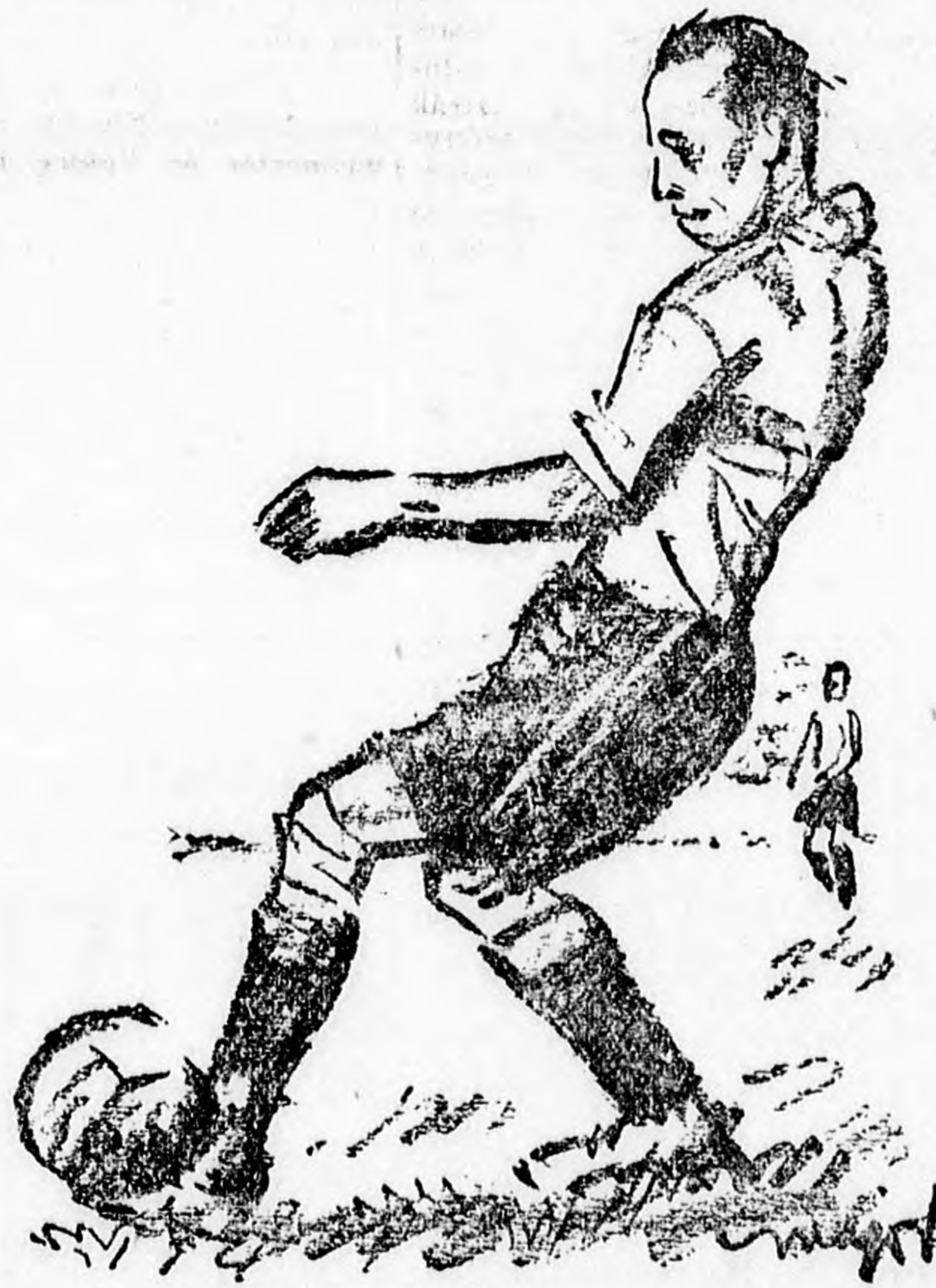
Andrade, a viághírű uruguay half