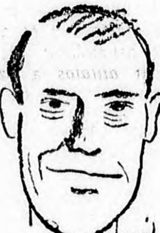
3. Calandra center