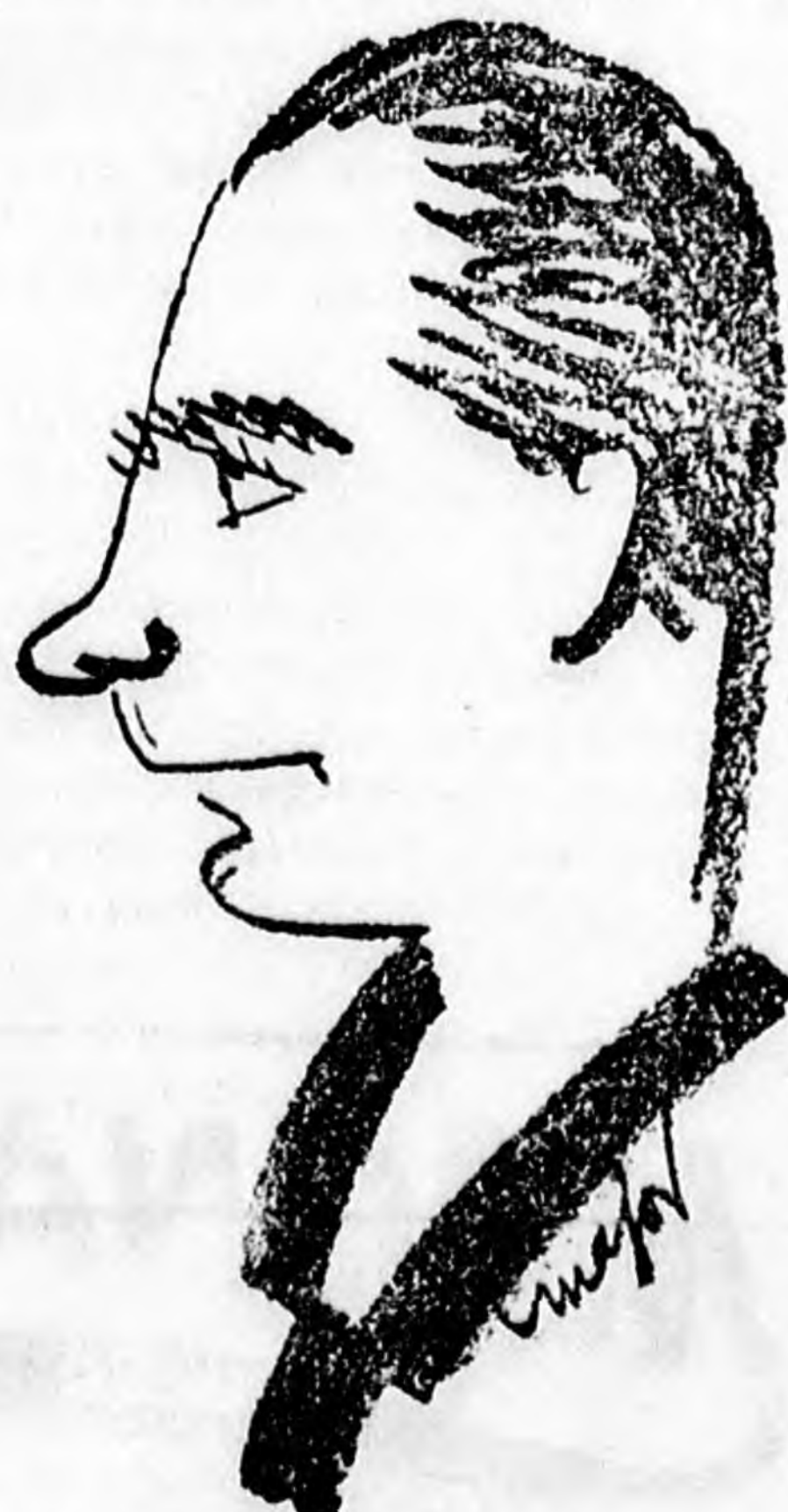
Dewis, a holland fn'ba'lszövetség kapitánya

hol közel huszonhétezer ember nézte végig a mérkőzést. A hollandok igen nagy lendülettel játszottak és 3:1 (2:0) arányban sikerült nekik megverni a belgákat. A másik vigasz-mérkőzés színhe-