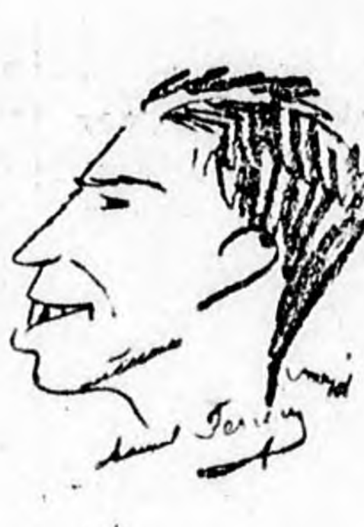
4. Tezzeria jobbösszekötő