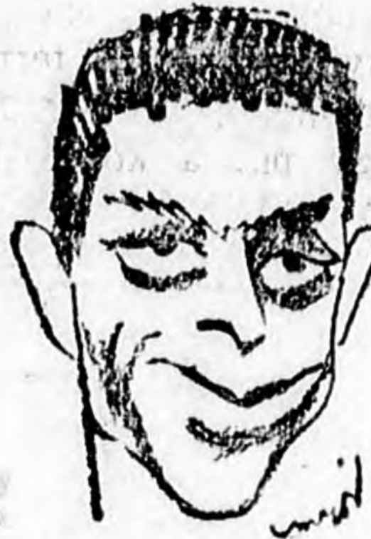
1. Paternoster balhátvéd

A stadion igazgatósága az Argentína—Uruguay meccsre ötvenezer nézőre számít. Valószínű, hogy lesznek is ennyien. Németországból különvonatok indulnak és a holland vidéki városok és ottani fogják a tömegeket. Attól nem kell félni, hogy a stadion szűk lesz ennyi embernek; hatvanezer ember is