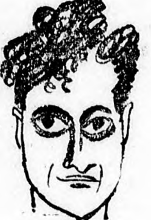
5. Poslo kapus