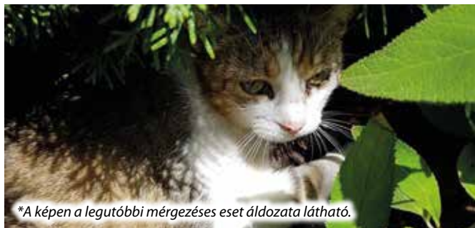
*A képen a legutóbbi mérgezéses eset áldozata látható.