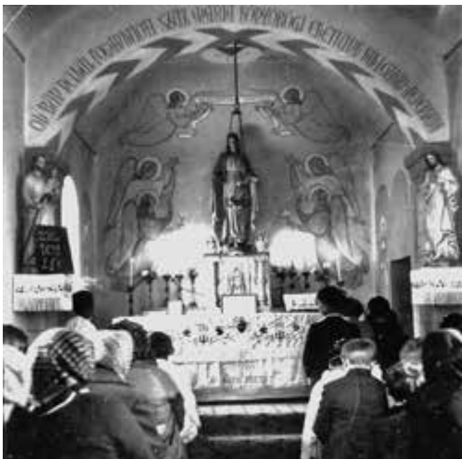
Ilyen volt 1970-ben