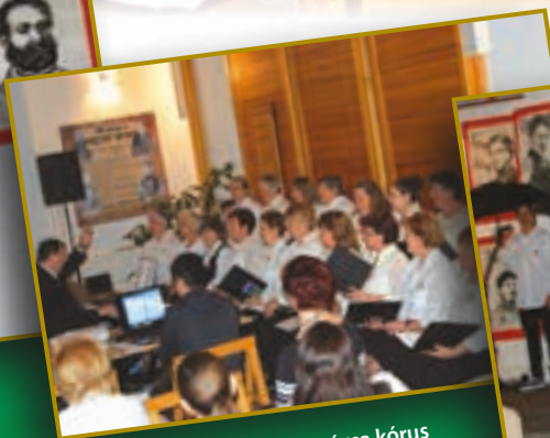
A Labdarózsa kórus