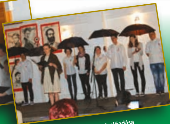
A 8-ik osztályosok előadása