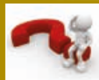
Mozaik – közérdekű információk