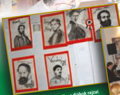
A 8-ik osztályos diákok rajzai