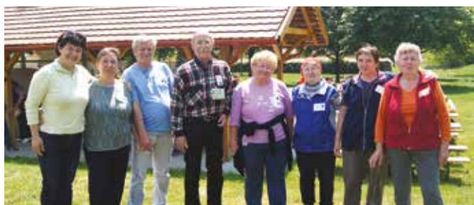
A fotók a 2015. évi TeSzedd rendezvényen készültek