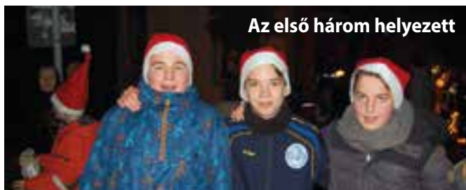
Az első három helyezett

kulás süveget. Minden résztvevő ajándék édességet kapott, melyből a támogatók jóvoltából annyi maradt, hogy egy második futamot is elindítottak a rendezők. A futásban kimelegedett sportolókat azután a tornacsarnok várta, ahová jelezték a Mikulás érkezését.