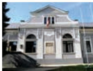
Töki Művelődési ház