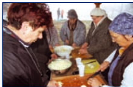
Életképek a 2012. decemberi falu-disznótorról