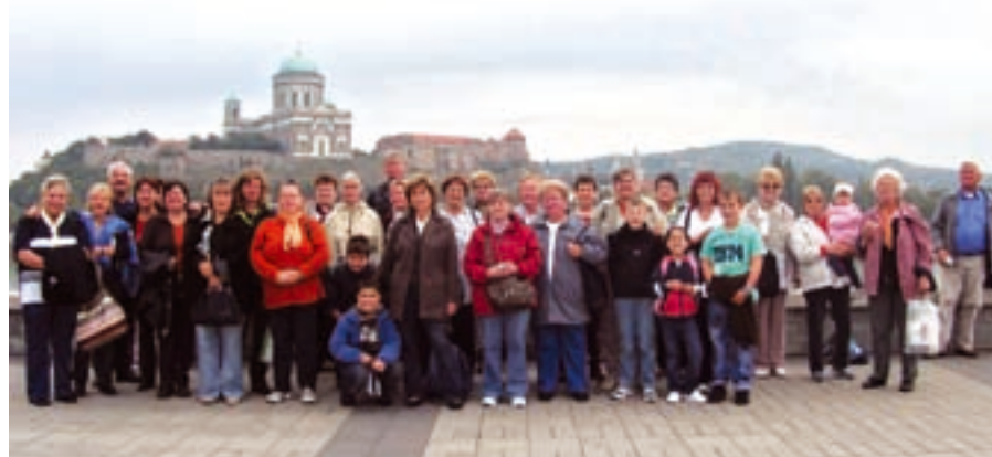
A Labdarózsa Kórus Egyesület esztergomi kiránduláson