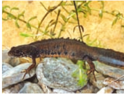
Dunai tarajos gőte

várt minket. Elmondta, hogy mi lesz a feladatumk. Bemutatta nekünk az itt leggyakoribb békafajt, a barna ásóbékát. Másfél kilométer hosszú szakaszon vödörkbe gyűjtöttük össze a kétélűeket. Legtöbbet a már említett barna ásóbékából találtunk, de volt szerencsénk dunai tarajos gőtéhez is. Összesen 219 állatot