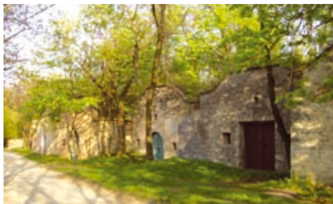
Pátyi Pincehegy pincésora

A programunk megvalósítására adományokat köszönettel fogadunk.