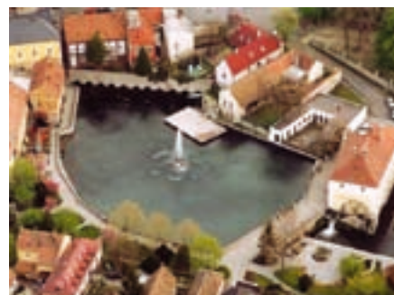
A tapolcai Malom-tó látképe