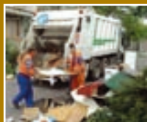
Lomtalanítás 4. oldal