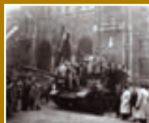
Meghívó az Október 23-i ünnepségre 5. oldal