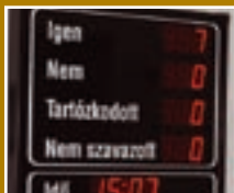
Tájékoztató testületi ülésről 2-4. oldal