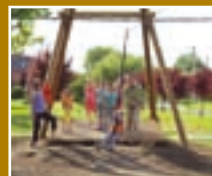
Játszóter szűpítés 10 oldal