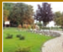
Mehrstetten park 10. oldal