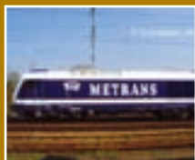
A Metrans beruházásról 4. oldal