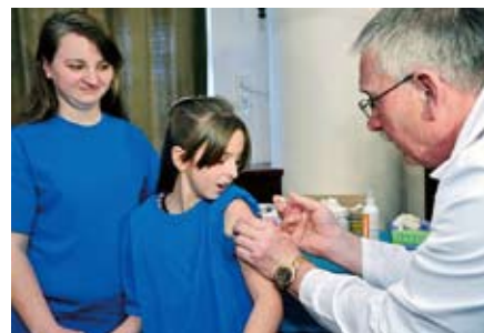
Google fotó (illusztráció)

Herceghalom Község Önkormányzatának Képviselő-testülete 50%-os támogatással biztosítja az 1997. január 1. és 1999. december 31. között született, állandó herceghalomi lakcímmel rendelkező, valamint a helyi oktatási intézmény 7–8. osztályaiban tanuló lányoknak a HPV elleni oltóanyagot.