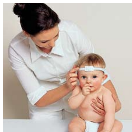
Google fotó (illusztráció)