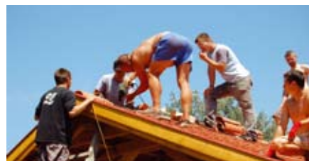
A tetőfedő brigád

hely a tető alatt megteríteni és élvezni a finomságokat, amelyek a kemencében sülték. Köszönet mindenkinek, aki részt vett a megvalósításban, kérik a használat során minden alkalommal az egészségükre koccintani egyet.