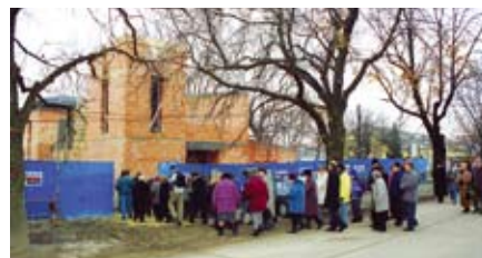
Sokan voltak kíváncsiak az építkezés alakulására

Ekkor indult el az a gyűjtés, amely a vállalatok és magánszemélyek adományaiból a források bővítését segítette. Így mintegy 10 millió forint gyűlt össze. Testvértelepülésünkön Mehrstettenben is gyűjtés kezdődött, hogy ők adhassák a harangot. Továbbá pályázatot nyert Herceghalom Német Kisebbségi