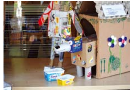
Az első helyezett alkotás