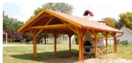
Az elkészült kemence tető