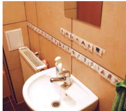
A mosdóban kommunikációs kártyák segítik a gyerekek eligazodását

sok, lovas terápiás foglalkozás, autizmus specifikus vizsgálatok, fejlesztés, Ayres szülő-, pedagógus-, konfliktuskezelő és önismereti tréningek, mentálhigiénés szakszolgálat, család és párkapcsolati tanácsadás, korokán masszáz, bio- és neurofeedback.