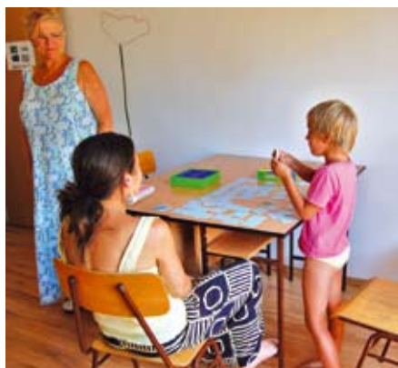
Önkéntes segítő foglalkozik az egyik kisgyerekekkel

Központunk hiánypótló szolgáltatás a térségben. Fő profilunk a viselkedés zavarral élő (autista, hiperaktív) gyermekek fejlesztése. Második tábori hetünket zártuk, gyermekeink nagyon szépen fejlődtek e rövid idő alatt is, ami azt mutatja, hogy erre a szolgáltatásra óriási szükség van. A szigorú keretek, a napi-rendí és kommunikációs kártyák, a folyamat ábrák használata, a feltétel nélküli szeretet, a vízi foglalkozások, a lovaglás és az állatsimogatás, a zeneterápia, és mozgásfejlesztés, ka-