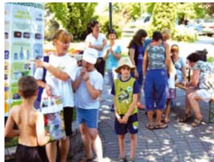
A résztvevők egyik csapata

Június 23-án ismét egy „Írtó jó nap” volt Herceghalomban. Kora reggel gyülekeztek a parlagfü ádáz ellenségei a Kulturális Egyház Központban. Megalakultak a csapatok és mindenki megkapta annak a területnek a térképét, amelyet vizsgálnia kellett, van-e parlagfü az adott részen. Ahol találtak, oda be-