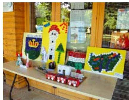
Részlet a hulladék-szobor kiállításból

A falu bejárása után egészséges termékekből készült ebédet és sok gyümölcsöt kaptak a résztvevők.