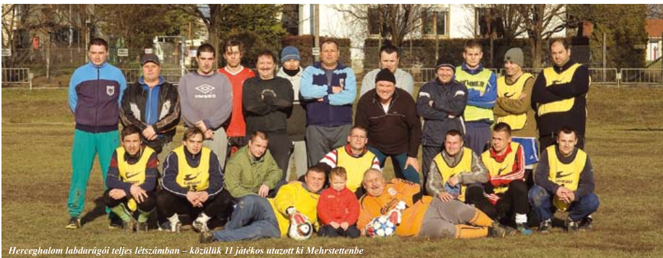
Herceghalom labdarúgói teljes létszámban – közülük 11 játékos utazott ki Mehrstettenbe