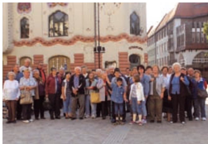
A Cifra Palota előtt

2012. szeptember 29-én a Herceghalmi Nyugdíjas Klub a helyi Mozgáskorlátozottak Egyesületével közös kirándulást szervezett Kecskemétre és Cserkeszőlőre 50 fő részvételével. Első állomásunk Kecskemét főtere volt nagyon sok látnivalóval.