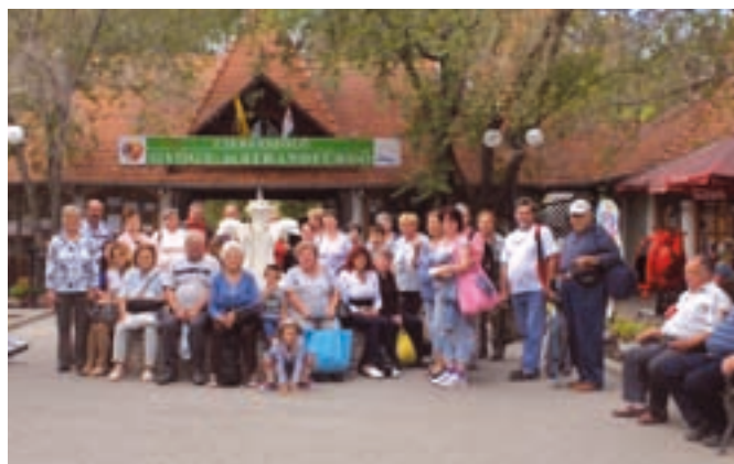
A cserkeszőlői gyógyfürdő bejáratánál