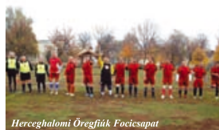
Herceghalomi Öregfiúk Focicsapat

Már most jelezzük, hogy az idén is rendezünk Karácsonyi focit december 25-én és Szilveszteri focit december 31-én. Ide korosztálytól függetlenül mindenkit szeretettel várunk.