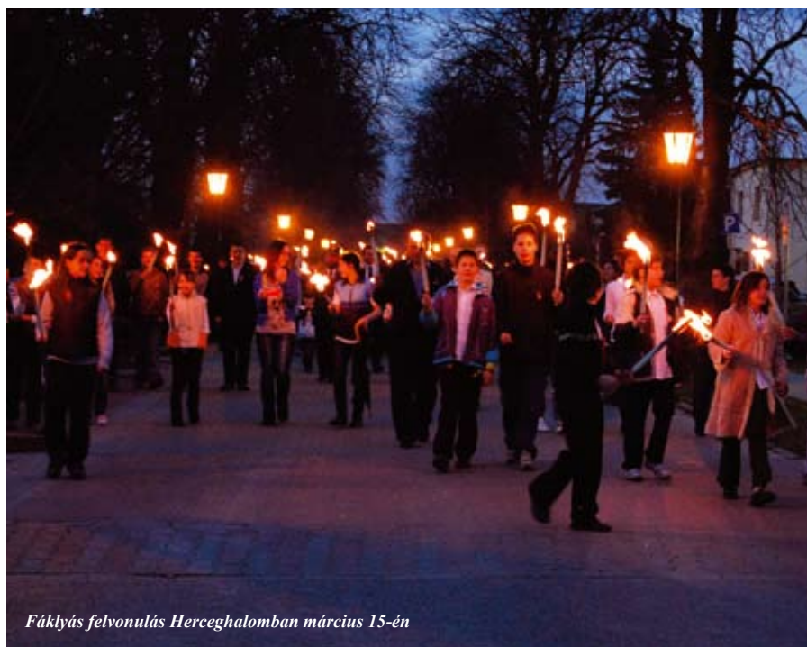
Fáklyás felvonulás Herceghalomban március 15-én

Végül 1849. augusztus 13-án Görgey Artúr Világosnál leteszi a fegyvert Fjodor Rüdiger orosz tábornok előtt. A magyar szabadságharc elbukott.