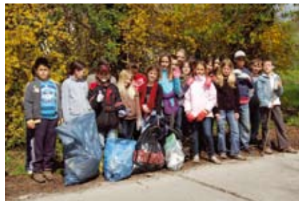
Ez lett az eredmény