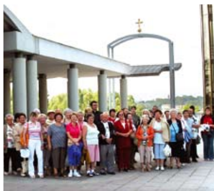
Herceghalomi csoport a krakkói Isteni Irgalmasság Bazilika előtt

„AZ ISTENI IRGALMASSÁG VASÁRNAPJA” (Édesanyák napja és búzaszentelő). Ezt a vasárnapot II. János Pál pápa 2000-ben Szent Fausztina nővér közlése alapján az Irgalmasság vasárnapjának nyilvánította. Jézus első alkalommal 1931-ben, Plockban (Lengyelország) beszélt Fausztina nővérnek arról, hogy: „ Azt kívánom, hogy legyen az Irgalmasságnak ünnepe. Azt kívánom, hogy a képet, melyet ecsettel fogsz megfesteni, hűsvét után az első vasárnapon ünnepélyesen áldják meg! Ez a vasárnap legyen az Irgalmasság ünnepe! ” (Napló 49)