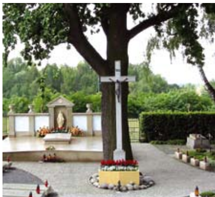
Fausztina nővér sírja Krakkóban Bazilika előtt

Itt hívjuk fel a figyelmet, hogy XVI. Benedek pápa május 1-én avatja boldoggá Rómában II. János Pál pápát. Imádkozzál érte!