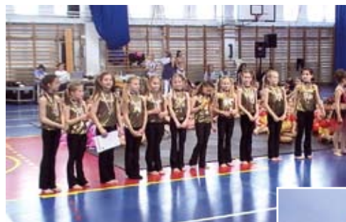
A herceghalomi fitness csoport