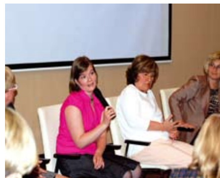
Az előadók kérdésekre válaszoltak

A fórum már egy újabbra ösztönöz, hiszen ezen a rendezvényen megismerhették a résztvevők a témát és a továbbiakban ráterhetnek a helyi szolgáltatók megismerésére (Korai