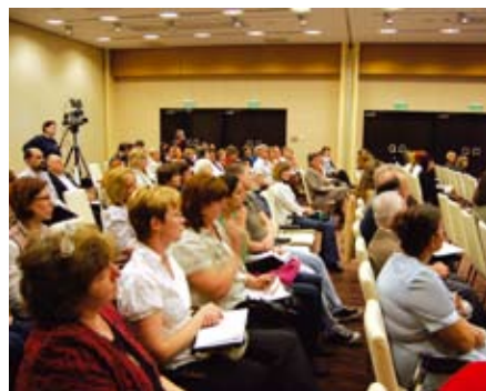
Részvevők az Abacus Hotelben

A fórum fő témája egy közoktatási intézmény, a pedagógiai szakszolgálat megismeretése, az ebben rejlő térségi feladatellátáshoz kapcsolható lehetőségek feltérképezése volt. Ez a forma egy a közoktatás szolgáltatásai közül. Kiemelten a sajátos nevelési igényű gyermekek ellátását végzi, de a logopédia, gyógytestnevelés esetében sokkal több gyermeket érint ez az ellátási forma.