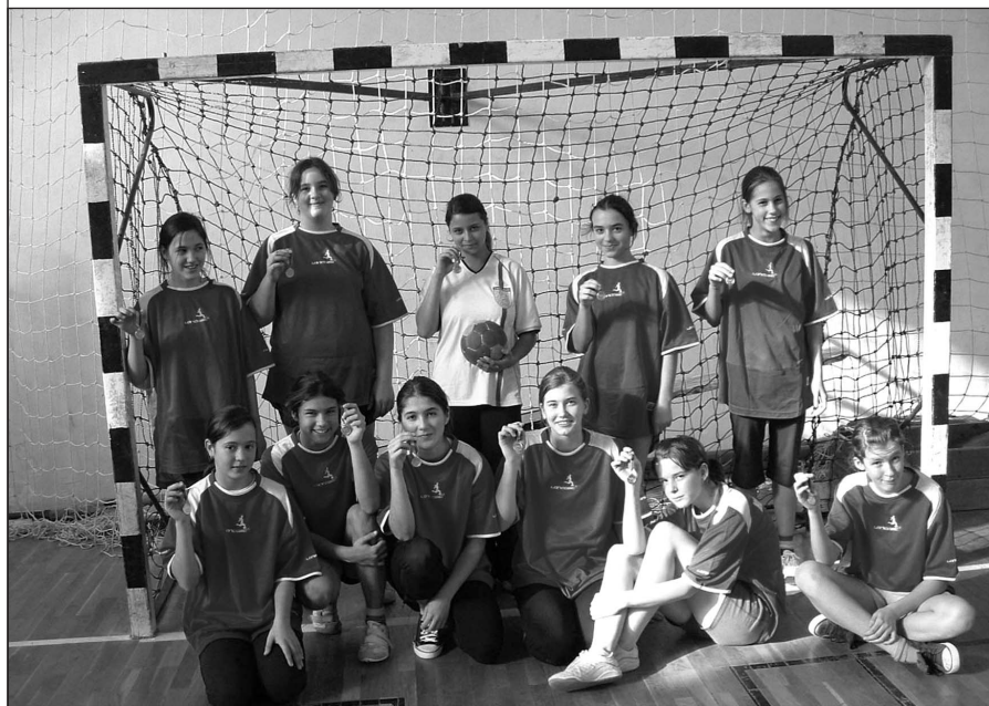
Az aranyérmes csapat