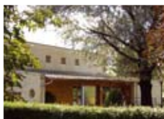
Közmeghallgatás lesz 2011. januárban 4.