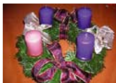
Advent 2010 6.