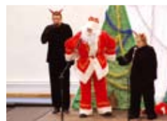
Mikulás járt Herceghalomban 10.