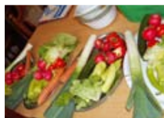
Egészségügyi nap az iskolában 7.