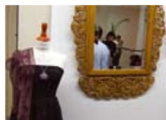
Kiállítás a könyvtárban 8.