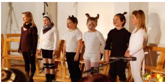
A 2. osztályos tanulók „Macskarácsony” előadásából

A Német Kisebbségi Önkormányzat képviselői nevében is köszönjük az Általános Iskola tanulóinak és felkészítő tanáraiknak kedves műsorát, valamint az adventi koncertet az etyeki Alte Edecker Musikanten zenekarnak.