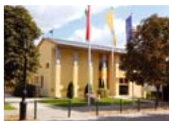
A Képviselőtestület üléséről. 2.