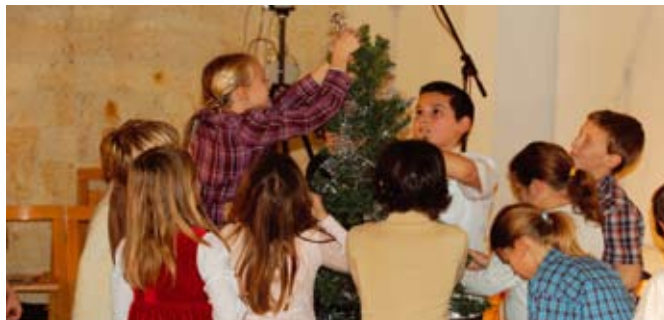
A 3. osztályos tanulók „Melyiket a kilenc közül” című előadásából

Együttal a község minden lakójának egészséget és áldott, békés Karácsonyi ünnepet kíván a Német Kisebbségi Önkormányzat elnöke és képviselői!