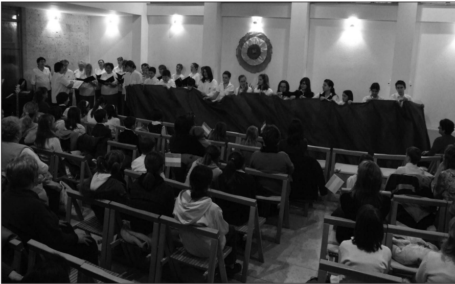
„Feltámadott a tenger” a színjátszók előadásában

A rossz idő miatt az idei március 15-i megemlékezést a KEK-ben tartottuk. A Labdarózsa Kórusunk és az iskola színjátszó csoportjának együttes műsora ismét emlékeztető, szép perceket szerzett az ünnep tiszteletére megjelent közönségnek.