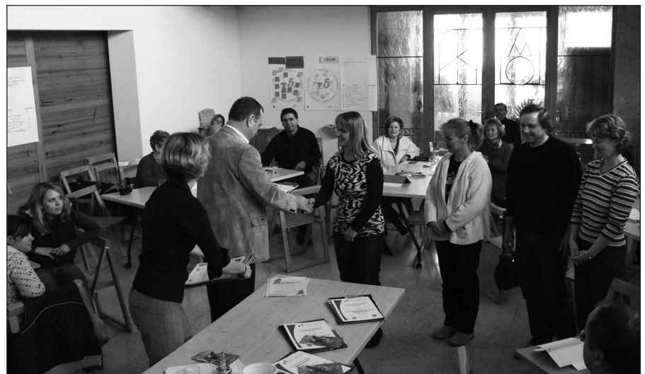
A „Kicsi gesztenye” győztes csapat

A munka keretén belül kiemelt szerepet kap az Ecorys Magyarország Kft. munkatársai által vezetett T5 településfejlesztési ötletbörze elnevezésű félnapos játék, amelynek során Herceghalom lakosai 5 csapat játékosaként versengenek a legjobb ötlet címért.