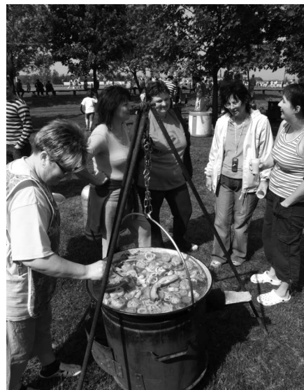
Készül a finom ebéd..