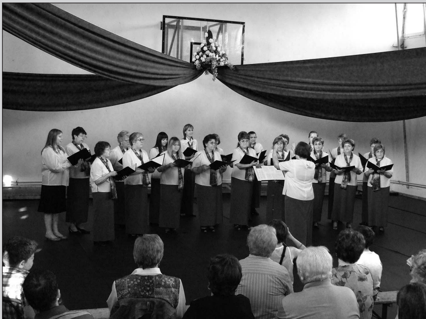
A tavalyi Kórustalálkozó...