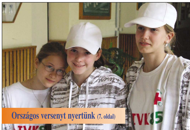
Országos versenyt nyertünk (7. oldal)