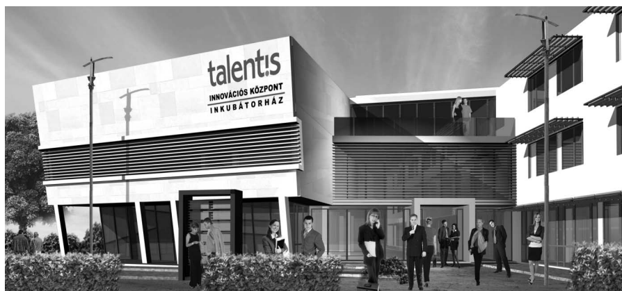
A Talentis Business Park látványterve

Magyarország egyik legnagyobb technológiai és innovációs központjának építése november 14-én alapkőletétellel indul. A Talentis Business Park a Zsámbéki-medence tudásalapú