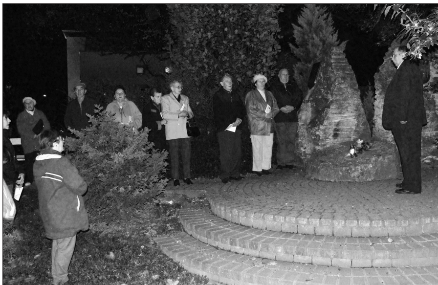
A Millecentenáriumi Emlékműnél