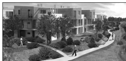
A lakópark látványterve

A program a természeti környezet megóvása mellett képes több száz magas színvonalú munkahely megteremtésére: csak a konferencia központban mintegy százötvenen helyezkedhetnek el. Ma Magyarországon kizárólag optimális lélekszám mellett tartható fenn magas színvonalú óvoda, iskola, és biztosítható a megfelelő banki, és egyéb szolgáltatás. Az önkormányzattal közösen átgondolt fejlesztés eredményeként több bevétel érkezik Herceghalomra, és ez a kedvező folyamat hosszútávon is fenntartható lesz. A program csodákat