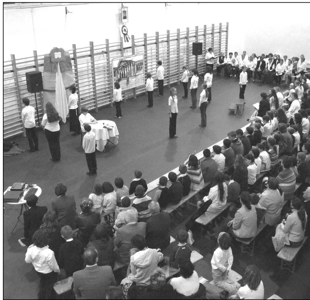
Három Az irodalmi műsor

A kissé hűvös estén, jólesett a forró tea és aprósütemény, amely az Önkormányzat anyagi hozzájárulásával a KEK előtt várta a felvonulókat.