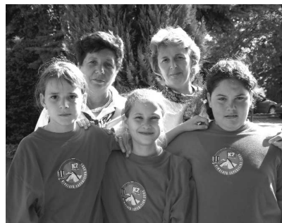
A győztes csapat és felkészítői

(Hasonló sikertörténetek a jövőben is olvashatók lesznek az újságban. a Szerk.)