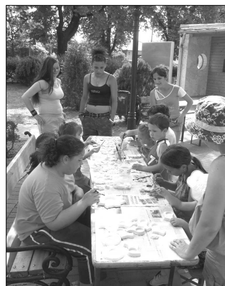
A „kreatív” asztaloknál

Ismét eltelt egy év és újra birtokba vehették a gyerekek a Sportpályát és környékét. Délelőtt 10 órától légvár, rodeobika, mini homokfutó autók, elektromos kisautók, gondoskodtak a szórakozásról. A kreatív asztaloknál gipszfigurákat festhettek, só-liszt gyurma segítségével próbálkozhattak a háromdimenziós ábrázolással, de volt itt arcfestés, matrica tetoválás, henna festés is. Az ügyes kezűek megmérethették magukat az aszfaltrajzversenyen. Akiket nem kötöttek le a kézműves programok, azokat, lovaglás, lovas kocsikázás, lovas torna bemutató, zsákbamaczka várta. A legkisebbekről a bébi játszótér gondoskodott. A „Mosolysziget” kedvezményes büfétjét vattacukros,