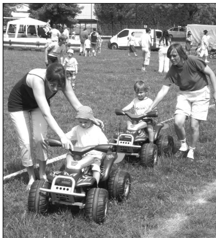
A mini homokfutók

agyaltos, kiürtöskalácsos, édesség árus és a Labdarózsa Kórus lángosa színesítette. Tizenegy órára megérkezett a Bicskei Tűzoltóság, a Biatorbágyi Közbiztonságért Alapítvány és az Országos Mentőszolgálat csapata is akik egy komplett terror és katasztrófa elhárítási bemutatót tartottak az ér-