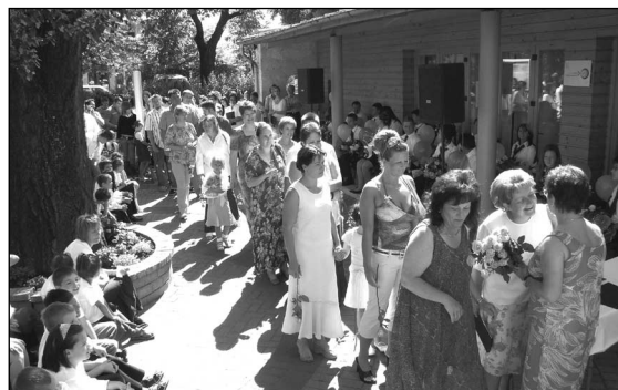
Minden évfolyamból egy-egy volt diákja rózsával köszöntötte