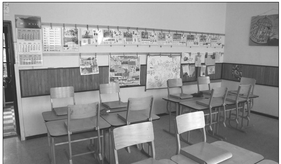
A felújított régi tanterem

A másik jubileum „csak” 50 éves, amely egy diploma megszerzéséhez kötődik. Tulajdonosa szintén herceghalmi tanító néni: Szegfű Ibolya aki 1960 – 1992 között tanította itt a nebulókat. Szeretettel köszöntöm körünkben, akit Herceghalom Község Önkormányzatának Képviselő-testülete jubileumi jutalomban részesített, megköszönve áldozatos, szeretetteljes, eredményes tevékenységét.