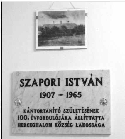
A márvány emléktábla

tot. Ezt az összeget egészítették ki a tartalékalapból, hogy a 75.248.000.-Ft összköltségű épület elkészülhessen. Köszönötünket fejezzük ki az építőknek, kivitelezőknek, tervezőknek, közülük is kiemelném községünk lakóját Szoják Balázst. A Talentis programiroda pedig 6 számítógépet, 12 monitort, 1 Laptop-ot, 1 projektort és 1 interaktív táblát ajándékozott iskolánknak.