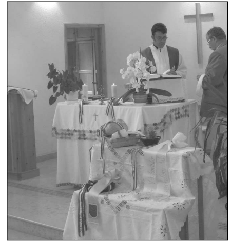
Az ünnepi mise

Sajnálatos módon a Honfoglalás kori bemutató és egyéb érdekességek nem keltették fel községünk lakosainak érdeklődését. Senki sem volt kíváncsi a jurta sátorban bemutatott különlegességekre, az íjászzkodási lehetőségre vagy a körhinta nyújtotta élvezetekre.