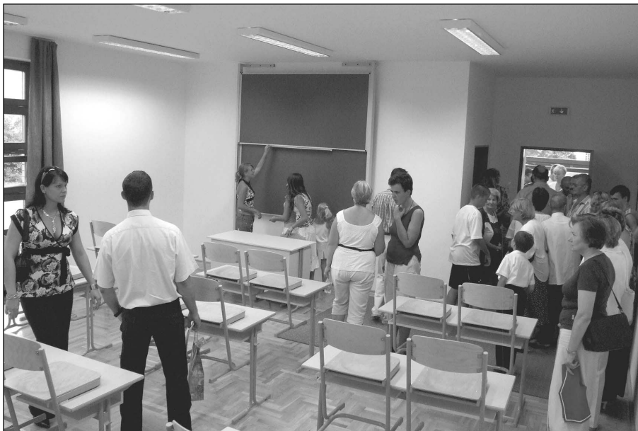
A résztvevők megnézik az új iskola termeit