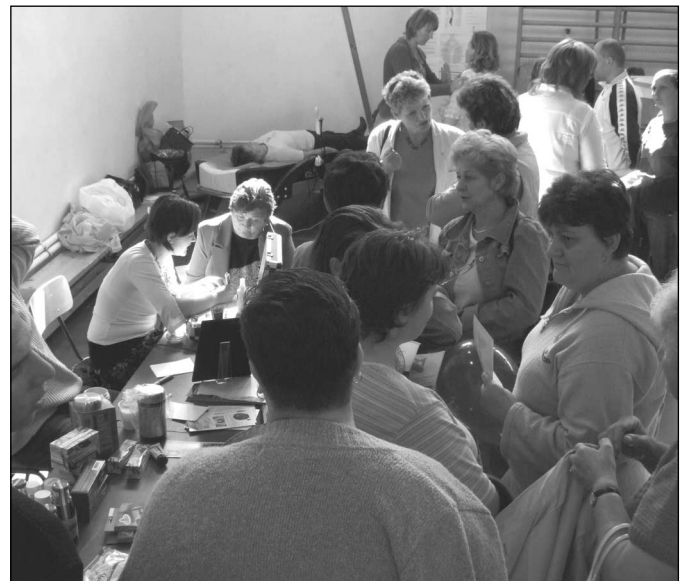
Az energiaszint mérésre sokan várhoztak

- egészségügyi totó 20 gyerek, 15 felnőtt Aki ettől a sok vizsgálttól megéhezett, azt a diétás termékeket árusító büfé várta, természetes alapanyagokból készített egészséges harapni- és inni valóval. Helyi és környékbeli településekről gyógyszer-gyártó cégektől szűrést és bemutatót tartottak. Soka-