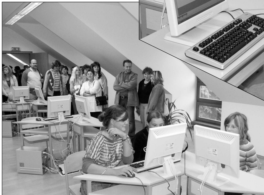
Szülők és a diákok az új számítástechnikai tanteremben