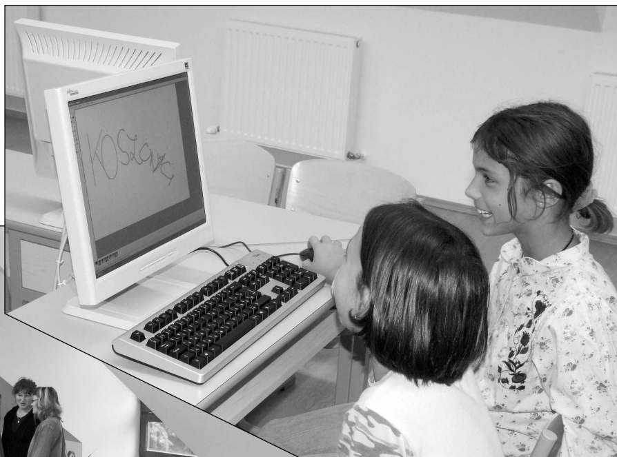
A kisdíások örülnek a számítógépnek

Ez nem mese, ez a valóság: fogalmazott az