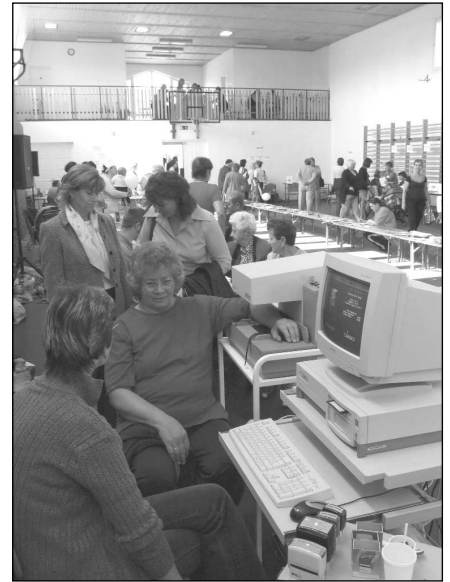
A csontritkulás mérésén