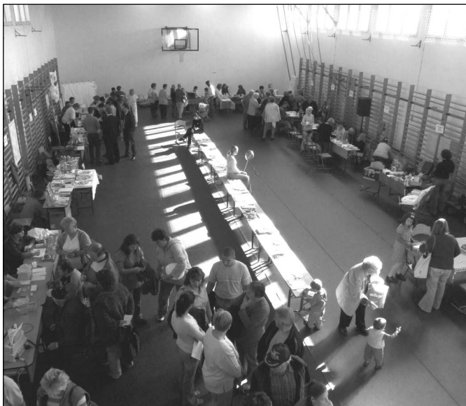
Sokan jöttek el az egészségnapra