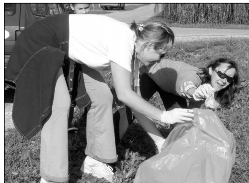
A községben gyűjtik a szemetet.

Negyedik alkalommal gyűltek össze községünk lakói október 6-án, a Helyiek Herceghalomért Egyesület, a Labdarózsa Kórus Egyesület és a Mosolysziget Nagycsaládok Egyesületének hívó szavára, hogy környezetüket szebbé, tisztábbá és