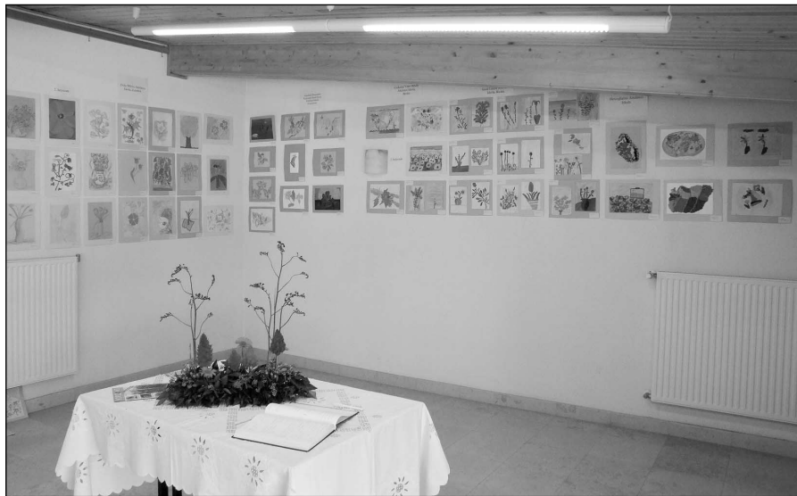
A kiállítás képei

A Horizont magazin és a Holland Virágiroda közös gyermekrajz pályázatának kiállítási megnyitóján szeptember