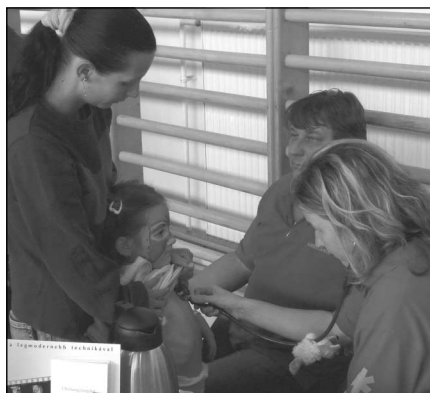
Tessék engem is megvizsgálni