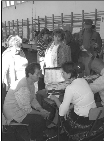
A szűrés eredményének megbeszélése