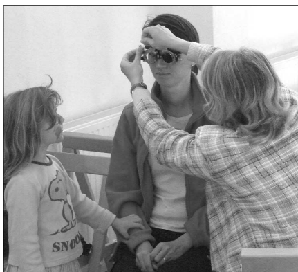
Anyukám szemüveges lesz