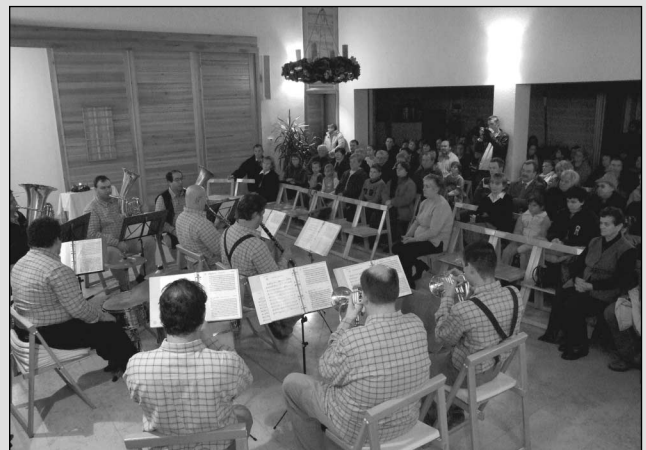
A Brüders Kapelle zenekar műsora