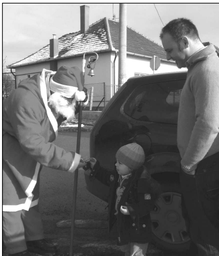
A Mikulás bácsi a faluban

Az Onkormányzat anyagi támogatásával az idei évben is ellátogatott községünk gyermekeihez a Mikulás. A bátrabbak december 1-én már a délelőtti folyamán találkozhattak