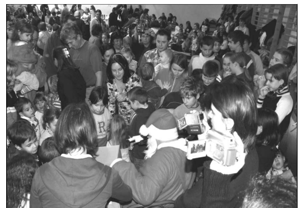
A Mikulás bácsi a Tornacsarnokban a gyerekek gyűrűjében