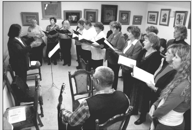
A Labdarózsa Kórus énekel