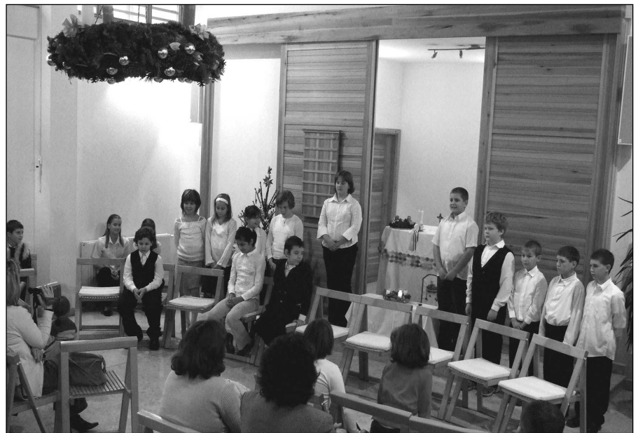
A diákok műsora.