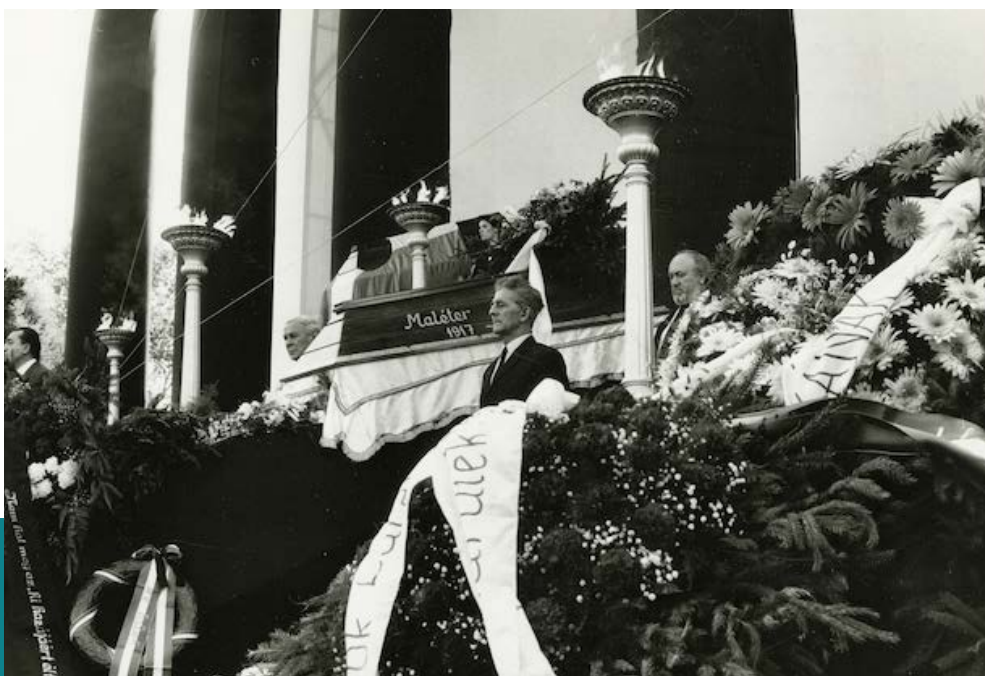
Nagy Imre és társai újratemetése, 1989. június 16. Magyar Nemzeti Múzeum

A dolog mégsem teljesen reménytelen. Létezik egy olyan elem, amely legalábbis kétségeket támaszt az iránt, hogy akár még az adott esetben is maradéktalanul hatékony lehet a múlt emlékének a teljes és visszavonhatatlan törlése. Ha ilyen nagy súllyal esik a latba a jelen eszmei igazolhatósága szempontjából az elfelejtetni kívánt múlt, amint azt '56 Kádár-kori sorsa is példázza, akkor ez a felejtetési politika nagyon is törékeny. Hiszen minden rendszerkritikus megszólalás és aktus egyúttal a felejtésre ítélt múlt felhánytorgatásával párosul, hogy az eddig hidegen tartott múltból nyomban forró múlt válják – olyasvalami tehát, amelynek nagyon eleven lehet a jelenbeli aktualitása. Ez kellő magyarázattal szolgál arra nézve, hogy miért éppen az ötvenhatos mártírok ünnepélyes újratemetése, valamint a kádári megtorlás összes áldozatára való nyilvános emlékezési szertartás képezhette a rendszerváltás leváltásának a szimbolikus és egyben rituális aktusát. A kádári felejtetési politika jövője (pontosabban annak a vége) fejezi ki visszamenőleges érvénnyel, hogy mennyire nem számított lezárt, végképp elintézett (elfelejtett) ügynek a három és fél évtizeden át elhallgatott, elnémított és megrágalmazott