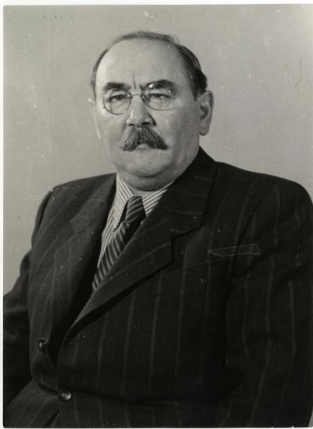
Nagy Imre, 1953.

A kádári hatalom egyszerre alkalmazta a múltra emlékeztető és a múltat elfelejtető stratégiát '56 kapcsán. Közismert, hogy milyen nagy hangsúlyt helyezett ez a propaganda annak szüntelen sulykolására, hogy az '56-os ún. ellenforradalom a véres erőszakban fogant és az volt a fő attribútuma. Ezt a célt szolgálta a Köztársaság téri lincselés történéseinek kiemelése az októberi események láncolatából, hogy – szinekdoché módján – ezt az eseményt tegye meg '56 lényegének. 19 Ez a velejéig hamis beállítás, melynek eredményeként partikuláris eseményeket az általánosság fokára emelnek, hogy úgymond mindent kimondjunk vele a dolgról, kettős célt szolgált: egyfelől valami látszólag ténybelit állított a megrágalmazotról ('56 a maga különösen véres-erőszakos fellépésével tüntette ki magát), másfelől el is terelte a figyelmet saját, szintén ténszerű akkori erőszakos tetteiről. Napnál világosabb, hogy az utóbbi a felejtés, a felejtetés érdekében történt, és így a Köztársaság téri véres eseményekre való szüntelen rámutatással azt a fedőemléket hozta létre, amely törörlhette az október 25-i Kossuth téri vérengzés emlékét a történelmi memóriából. A Kossuth téri tömeggyűlést érő mézárulás, mint tudjuk, a védekezésre, egyben a rejtőzködésre kényszerülő rákosista hatalmi csoportok (valójában az ávósok) akciója volt, és összemérhetet-