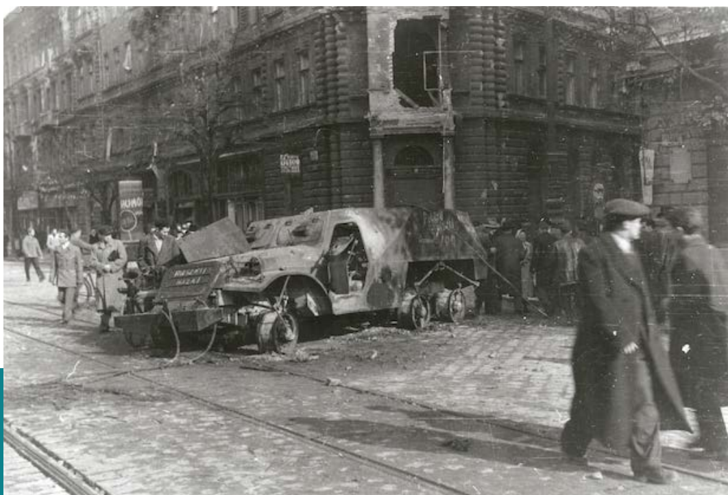
Kilőtt szovjet páncélautó a József körúton, ruszlik haza felirattal, 1956. október 26.

lenül több emberáldozattal járt (ráadásul a civil népesség köréből), mint amennyi halálos áldozatot a Köztársaság téri összecsapások követeltek. Erről a mézarlásról azonban sem ekkor, sem később nem esett, nem eshetett szó, így az elkövetők felelősségre vonása sem került szóba sem akkor, sem 1989/1990 után. Mondhatni: végzetes és örök amnézia homályába burkolták az ötvenhatos forradalom minden bizonnyal legbrutálisabb öldöklését, amelyet történetesen azok követtek el, akik – 1956 novembere 4-e után – újra kezükbe kaparintották a megszálló szovjet hadsereg jóvoltából a kizárólagos (és terrorral fenntartott) hatalmat. 20