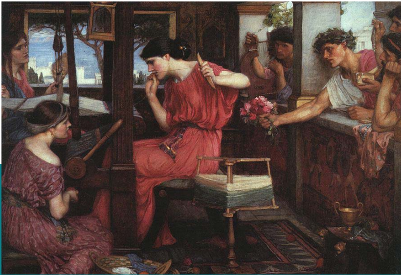
John William Waterhouse (1849–1917): Penelopé és a kérők, 1912.

Ily módon tehát Akhilleusz – jó néhány társához hasonlóan – menedékre lel saját kultuszában. De nem csupán a képzelet szülte térben, hanem alkalomadtán a valóságosban is. Ha már Pontoszban (a Fekete-tenger délkeleti partvidékén) járunk, mindenképpen meg kell említenünk Philosztratosz művének egy másik szöveghelyét is, ahol azt olvassuk, hogy Akhilleusz – Helenével együtt – Leukasz szigetén 60 él tovább, s ezt az arra járó hajósok is tanúsítják: „Akik kikötöttek már a szigeten, azt állítják, hogy lódobogást, fegyvercsörgést és csatakiáltásszerű hangokat hallottak.” ( Heroica , 56,2) 61 Úgy tűnik tehát, hogy a hősök végtelenül sokszor újraélik eposzbéli sorsukat. De nem csupán a harcokat élik újra, hanem addig sohasem hallott költeményeket is szereznek, egyebek közt Homérosz dicsőségét zengve: „Te pedig zengd az isteni Homéroszt,/ férfinak hírét,/ hősi munkáink hírét,/ akinek hála nem haltam meg.” 62 Ezen a ponton azonban a mitikus sors köre bezárul, úgy látszik, végérvényesen. Pedig nem így van, hiszen éppen ez az a pont, ahol az összes mitológiai lény (s nem csupán Dionüszosz), aki addig eleven örök múltjába