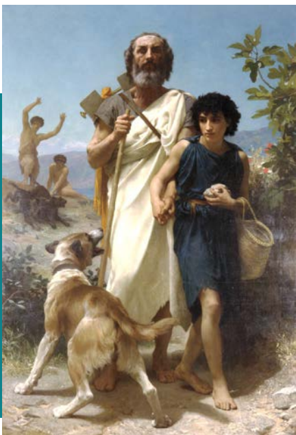
William-Adolphe Bouguereau (1825-1905): Homérosz és vezetője, 1874.