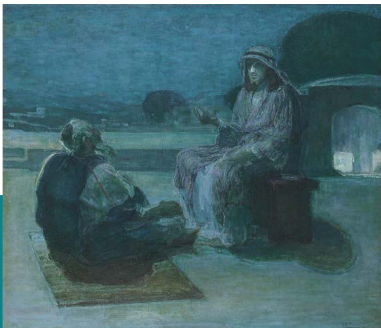
Henry Ossawa Tanner (1859–1937): Nikodémosz és Krisztus, 1899.

kinyilatkoztatás mindenségébe, már senki sem képes érzékelni túlvilági származását, mint ahogy megkülönböztethetetlen lesz a hadészi Aszfodéosz mező és a megszokott mediterrán táj, a rét, amely – Kerényi Károly költői megfogalmazásával – „ama magasra nőtt aszfodéoszokkal volt tele, melyeknek hamuszín virága szürkéslila fátyolként lebeg a Földközi-tenger számtalan parti mezején”. 18