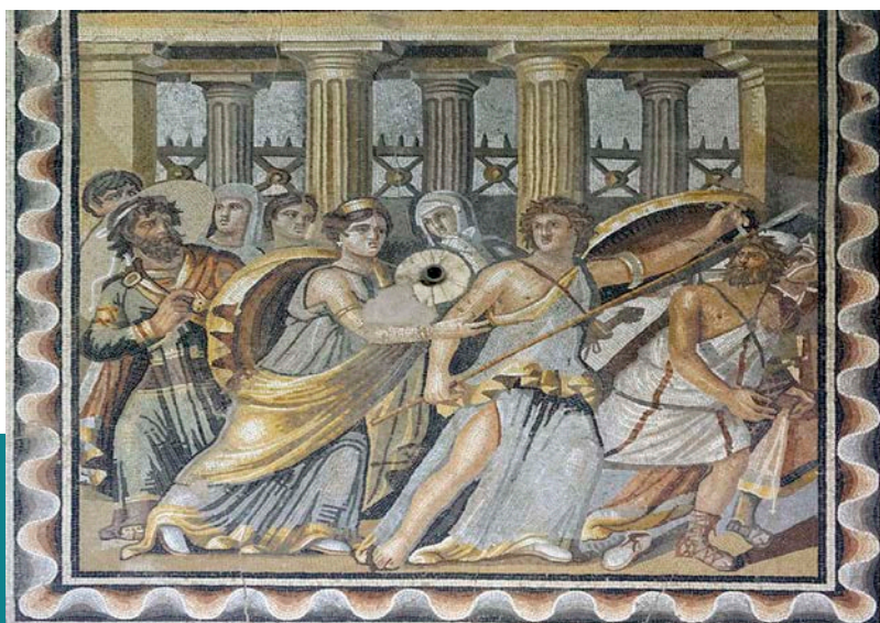
Római mozaik, Zeugma, Villa Poseidon, Akhilleusz és Odyszeusz ábrázolása Wikimedia Commons