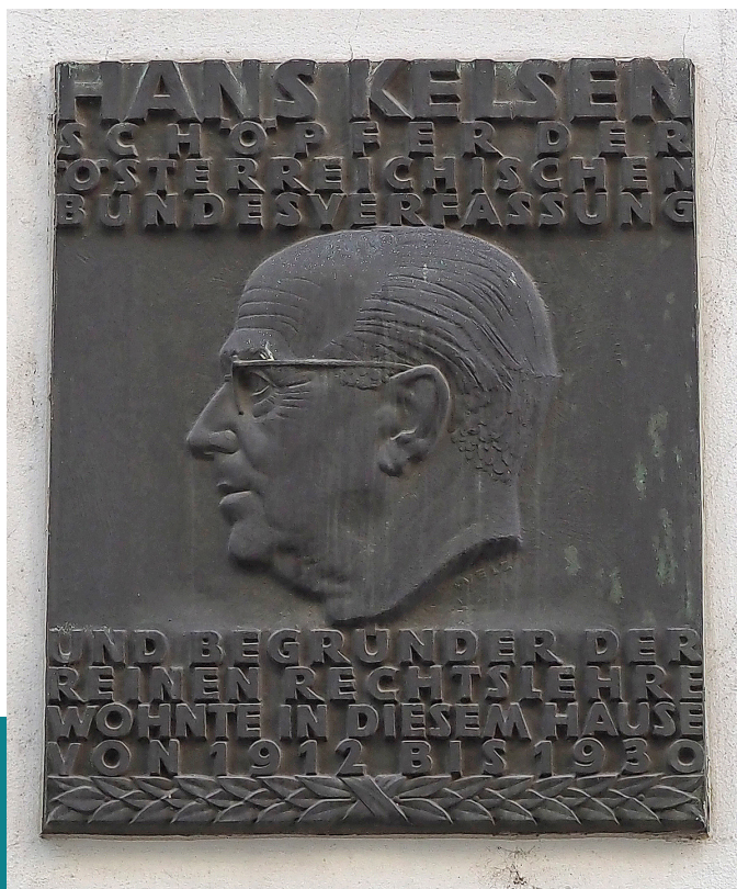
Emléktábla Hans Kelsen bécsi, 1912–1930 közötti lakóhelyének falán.

1867. évi Decemberi Alkotmány hatályba lépését követően lépcsőzetesen lebontott) középkori örökségtől, az államegyházi rendszerből fakadó szellemi abszolutizmustól. 35