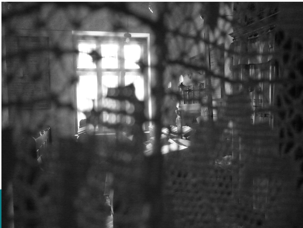
A képet a szerző készítette.

E jelenet súlyát valójában a novella eredeti jiddis változatából és a zsidó hagyományok ismeretében érthetjük meg. Az angol és a magyar fordításban a vers kezdete „Ésesz hájil” (אשת חיל) meg sincs említve. A hagyományt ismerők számára, ha a jiddist olvassák, egyértelmű, miről van szó: hagyománytartó zsidó családban minden szombaton éneklük ezt a verset, általában egy dal dallamára. Smuel-Lejbele tehát semmi különös nem vitt véghez, mindössze arról van szó, hogy ő ezt a régies és csaknem abszurd, erősen túlzó verses dicséretet nemcsak a szokás kedvéért olvasta föl, hanem mélyen átérezte, és személyesen Sosára vonatkoztatta. Ez a „többlet”, hogy az ezerszer és mindenki által minden szombaton mondott szöveg, Smuel-Lejbele számára igazivá vált – ez volt a legtöbb, amit Sosának adhatott.