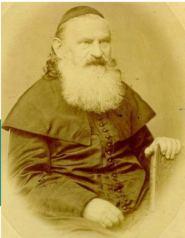
Löw Lipót, 1870-es évek