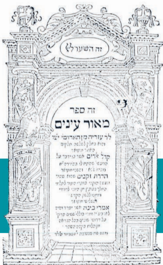
Azaria de’ Rossi (1511–1577): Meór Ėnajim, Mantua, 1573–1575.

vagy kétkedőnek sem”. 14 Nem tekinti a zsidó nép teljes jogú tagjának sem, ugyanakkor az olvasóra bízza, hogy a szigorúan vallási kérdéseket leszámítva miben ért vele egyet. 15 A későbbi zsidó hagyományban de’ Rossi műve lényegében feledésbe merült – és vele Philón is ismét. 16 Több mint két évszázaddal később viszont a 18. század végi berlini haszkala (Moses Mendelssohn, 1783), majd a 19. századi Wissenschaft des Judentums (Leopold Zunz, 1843) de’ Rossiban az egyik legfontosabb előfutárát ismerte fel. 17 Amennyiben tehát Philón magyar zsidó recepciója aránylag csekély volt, ez csak annyit jelent, hogy a magyar zsidó tudományos többség e tekintetben nem csatlakozott a külföldi, főként német Wissenschaft fokozódó érdeklődéséhez Philón iránt.