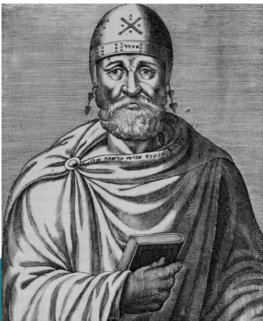
Alexandriai Philón. Rézmetszet illusztráció André Thevet (1516–1592): Les vrais pourtraits et vies des hommes illustres grecz, latins et payens (1584) művéből.