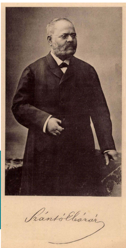
Szántó Eleázár, 1892.