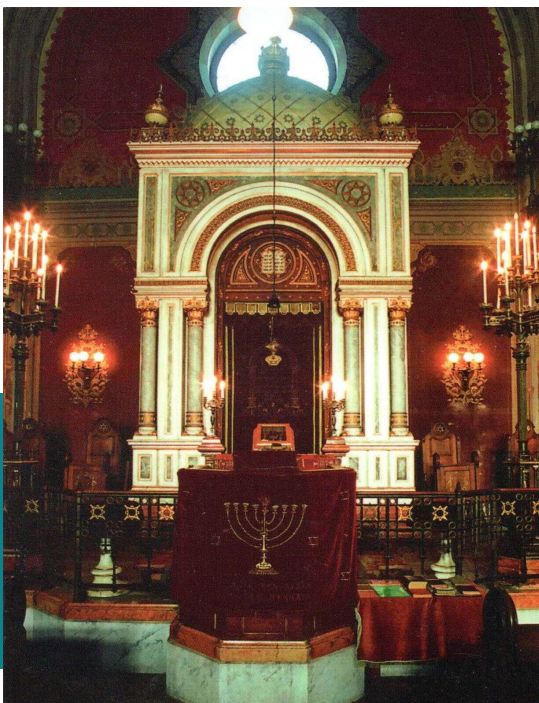
Pécs, a zsinagóga belső tere