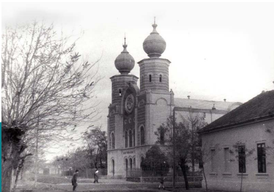
Békéscsaba, a neológ zsinagóga BékésWiki

Csak üzleti, nem voltak társadalmi kapcsolatok... A zsidók maguk között töltötték az idejüket. A nem zsidók nem fogadták be őket.” 41