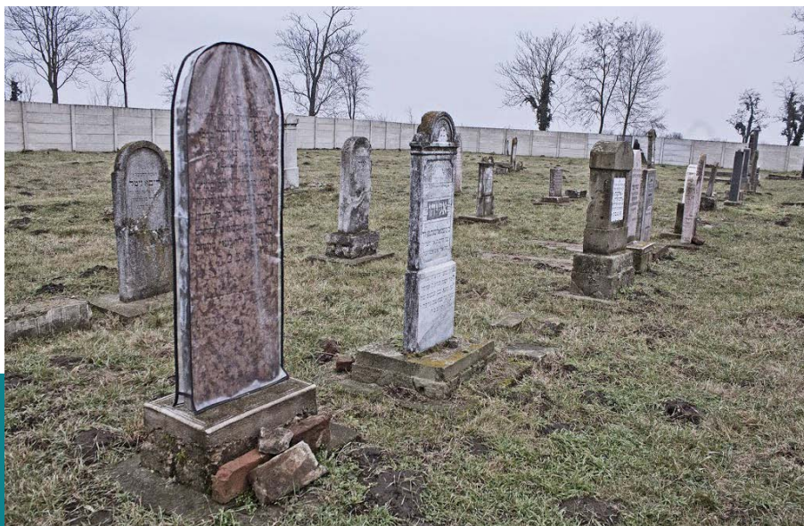
Derecske, a zsidó temető izraelitatemetok.hu

vallástalan jellegéről, a jiddis nyelvtudás hiányáról beszél, egyértelműen az orthodox közeg kulturális kódjait, nyelvi fordulatait használja. A különbözőségről beszél, a távolságról és ennek felemás kezeléséről, cinkos elleplezéséről, de egyben kigúnyolásáról, ám mindezt a közelség felmutatásával.