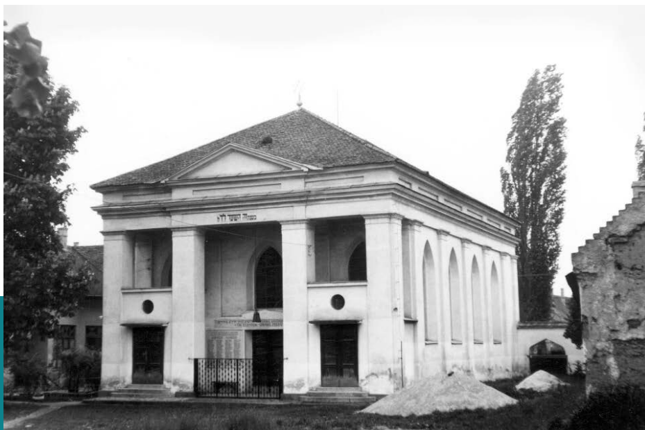
Kiskunhalas, a zsinagóga

A Hershtik család példája jól mutatja, hogy nemcsak az orthodoxia és a neológia között volt bizonyos átjárás, hanem a – sok helyzetben szintén ellenséges – orthodoxia és a haszidizmus között is. Mordechaj Hershtik egyszerre lehetett egy alföldi orthodox hitközség dajánja, a helyi modern orthodox nézeteket valló, egyetemi doktorátussal rendelkező rabbi, Dohány József (1881–1972) barátja, és a korabeli haszidizmus egyik meghatározó vezetőjének, Hajim Elazar Sapirának (1871–1937), a munkácsi rebbének közeli híve.