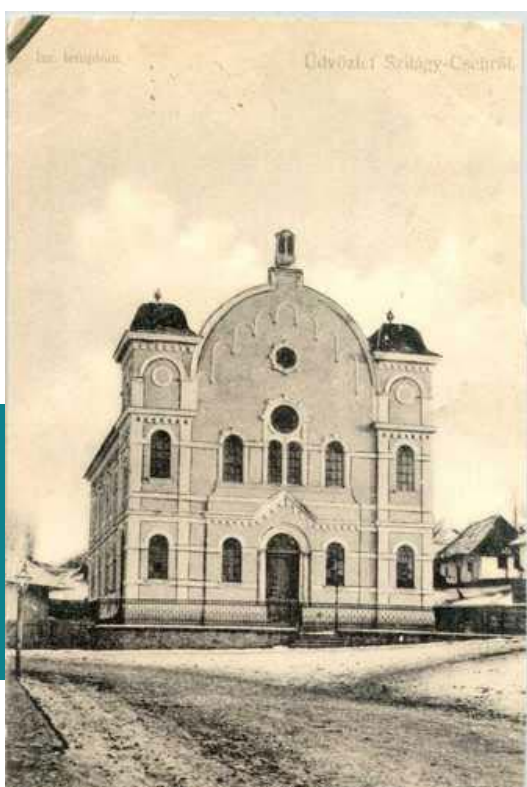
Szilágycseh, zsinagóga Magyar Zsidó Múzeum és Levéltár

A szilágycsehi orthodox közösségbe való betagozódásukat, közösségi elfogadásukat jelzi ugyanakkor, hogy a helyi jesiva rászoruló diákjai az ő asztaluknál is kaptak ellátást, vagyis a hagyományos kifejezéssel élve „napokat ettek”. Úgy tűnik, hogy sem a szombatszegő, pajesz nélküli családfő személye, sem a háztartás kóserságának megbízhatósága nem ébresztett kétségeket.