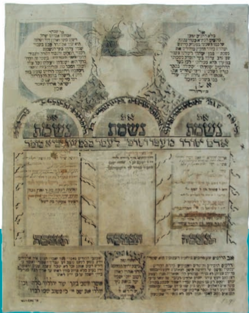
Tizsaszentimre, Jahrzeit tábla Magyar Zsidó Múzeum és Levéltár